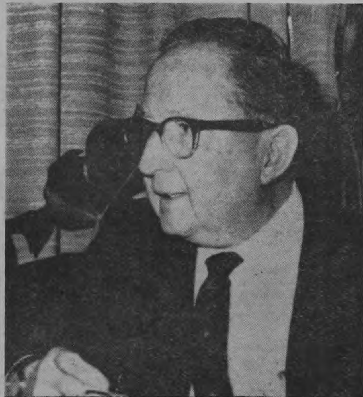
El Ex-Presidente de Guatemala don Miguel Ydigoras Fuentes llegó ayer y anuncia que radicará en Costa Rica.