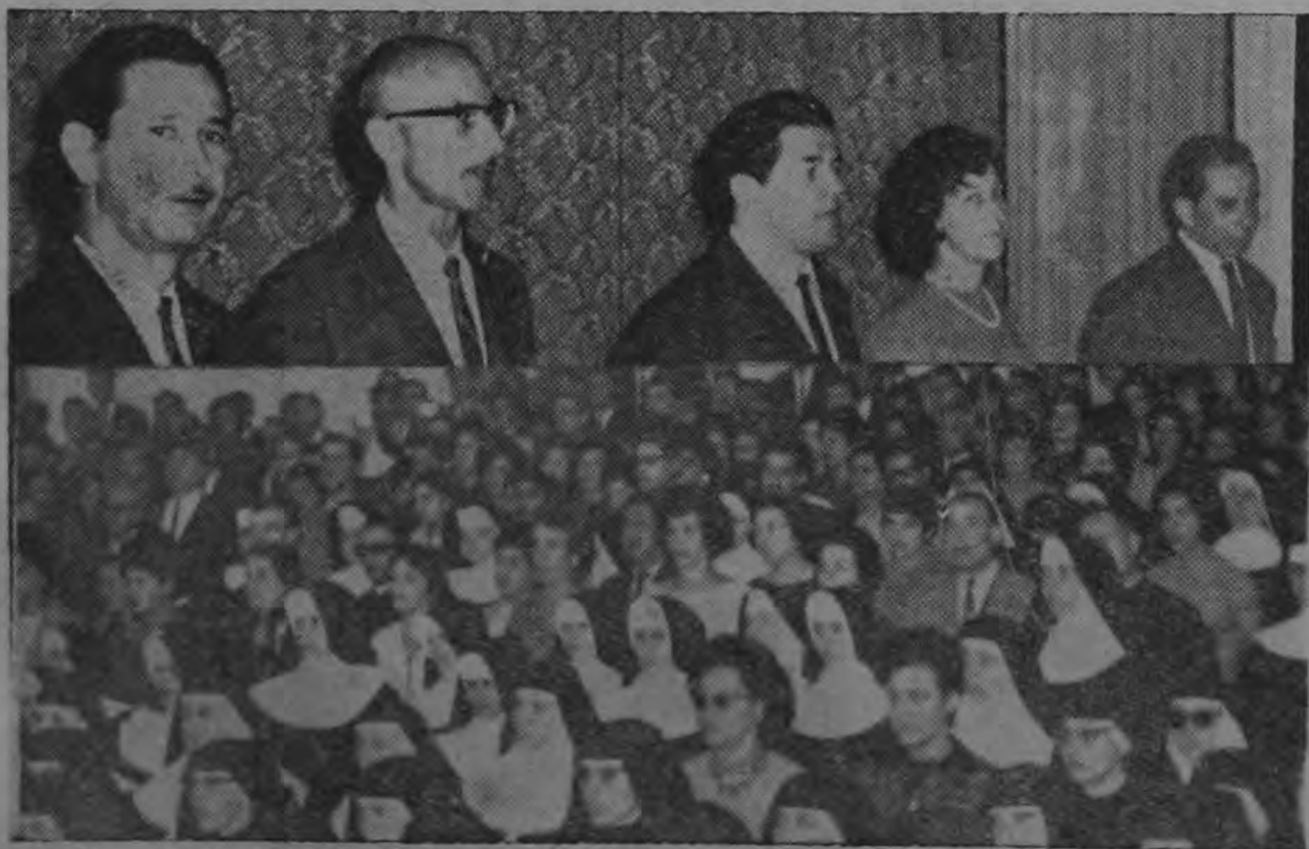
CURSO DE VERANO fue clausurado anoche en el Paraninfo de la Universidad (Barrio González Lahman) con asistencia de los profesores que asumirán la responsabilidad de la aplicación de la reforma en la Enseñanza Media.